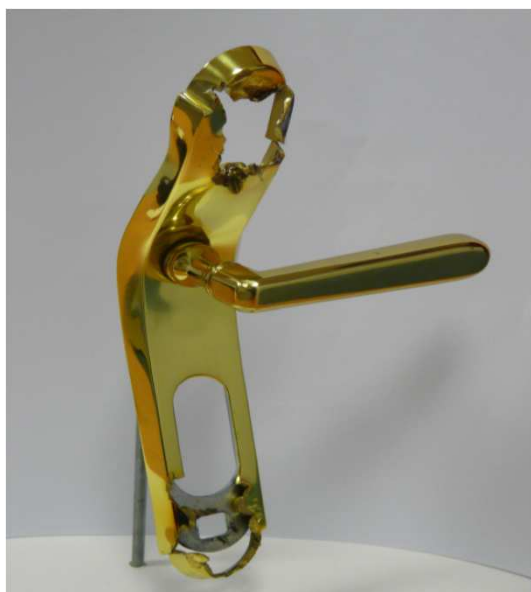
Obr.č.1 Celkový pohled na zničený štítek bezpečnostního kování

Iva Brabcová, referentka marketingového oddělení