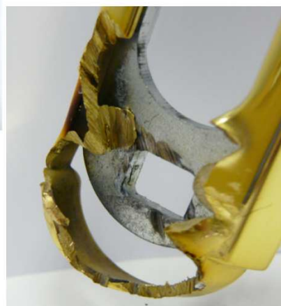
Obr.č.3 Detailní pohled na spodní část kování