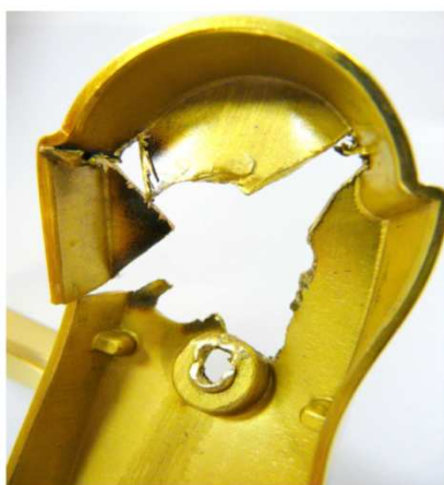
Obr.č.2 Detailní pohled na horní část kování