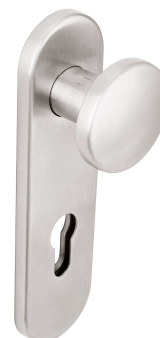
Obr.č. 3 : model TWIN ECO-mechanismus s madlem a štítek s koulí/vpravo/

Model ECO je designově jedinečný, nenarušuje interiér a je určen především do moderních objektů. S porovnáním obdobného panikového kování je jeho cena u firmy TWIN bezkonkurenční.